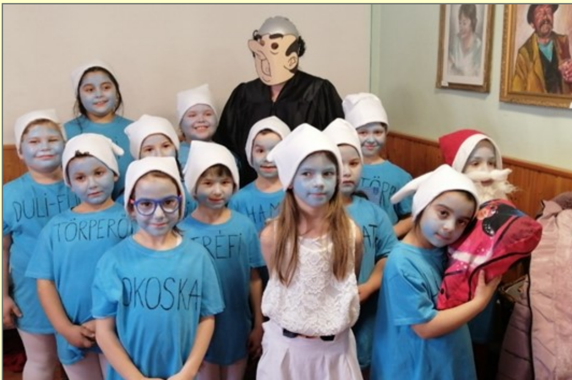
A csoportgyőztes 1. osztály, Hupikék Törpikék és Hókuszpók

A 2020-as esztendő első nagy eseménye iskolánkban a Farsang volt február 14-én. Az eseményre a Művelődési Házban került sor. Bárki megcsodálhatta az ötletesebbnél-ötletesebb jelmezeket, amelyeket a diákok kis segítséggel maguk készítettek. A jelmezesek felvonulását és értékelését követően, a tombolahúzás során rengeteg ajándék talált gazdára.