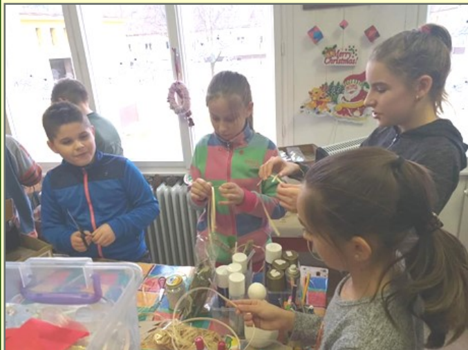
Készülnek az ünnepi díszek a szöszmötölésen

A vetélkedést követően ellátogatott iskolánkba is a Mikulás. Minden osztályba betért és minden diák munkáját értékelte. (A csasztuskákat az osztályfőnökök súgták a Télapónak.)